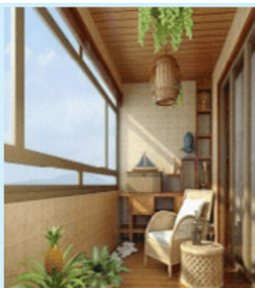
图2-1-8 温暖的封闭阳台