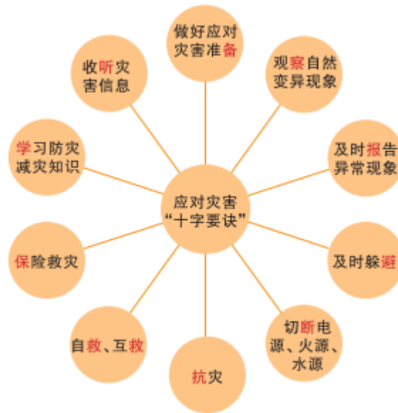
图4-2-3 个人应对灾害“十字要诀”示意

活动：我国在防灾减灾方面取得了巨大的成就。查阅文献，梳理一下我国近三十年在防灾减灾领域所取得的成就，在班上交流。