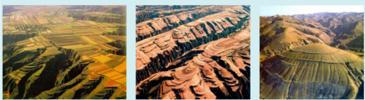
图3-5-12 黄土高原的塬、梁、峁

平坦的高原平面为“塬”。塬被分割成长条状，称为“梁”。梁再被沟谷切割，形成馒头状的山丘，称为“峁”。