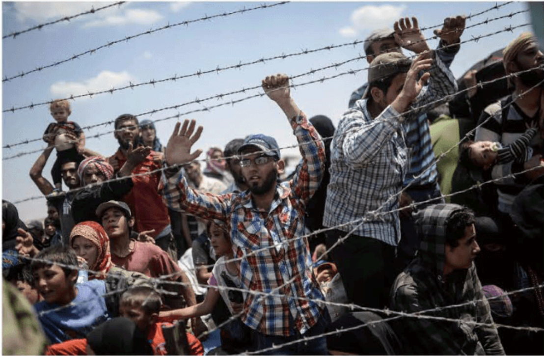
图 1-2-8 2015 年因战乱被迫迁移的叙利亚难民

社会文化因素：宗教、种族等社会文化因素会造成人口迁移。1947年的印巴分治，导致1000多万穆斯林从印度迁往巴基斯坦。另外，外出求学对人口迁移也会产生一定的影响。文化程度较高的人选择工作的机会多，较容易迁移。