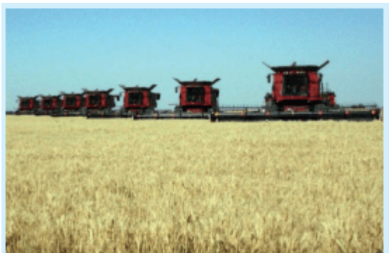
图3-1-17 美国中部平原小麦收割

商品谷物农业以小麦和玉米生产为主，产品主要面向市场，具有生产规模大、商品率高、机械化水平高等特点。美国是世界上最大的商品谷物生产国和出口国，其小麦、玉米等农产品在国际市场上占有重要地位。