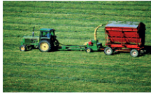
图 3-11 混合农业