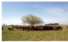
图 3-15 阿根廷潘帕斯草原上的畜牧业