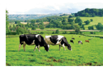
图 3-16 英国商业型乳酪业