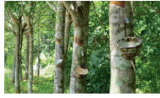
图 3-10 大种植园农业