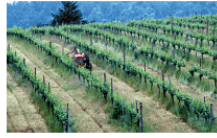
图 3-12 地中海型农业