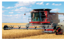
图 3-14 商业型谷物种植业