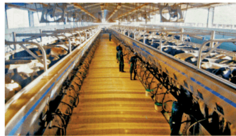
图 3-7 沙特阿拉伯利雅得近郊奶牛场