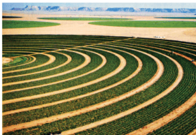
图 3-6 沙特阿拉伯灌溉农业——西红柿种植