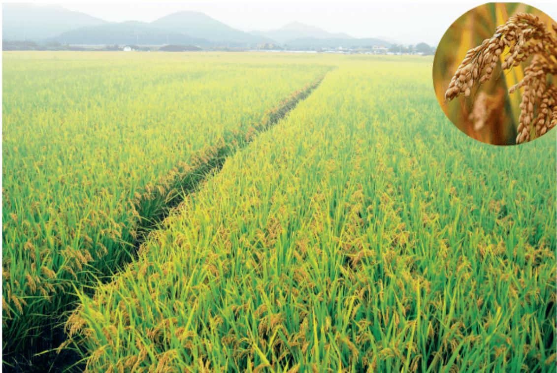
图 3-8 水稻种植

水稻是一种高产的农作物。从生长习性来看，水稻喜温喜湿，在生长过程中需要充足的光照和热量，尤其是需要大量的水分。水稻生产过程相对复杂，耗费劳动力较多，而且不太适合大规模的机械化经营。