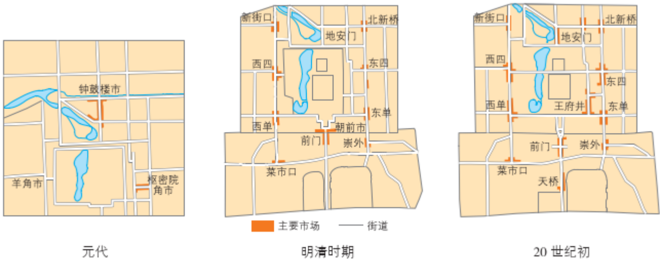
图 3-34 北京主要商业中心的演变

阅读下列材料，完成相关任务。自元代以来，北京不仅是首都，还作为重要的商业中心，经历了长期演变，逐渐形成了如今的商业格局。元代，依托大运河和发达的水陆交通，沿湖岸码头，靠近钟、鼓楼一带，形成了京城一级商业中心——钟鼓楼市，两个次级商业中心——枢密院角市和羊角市，分别位于皇城东西门外。明清时期，由于城内码头和航道的废弃，并随着紫禁城的扩建，分别形成了以前门为核心的一级中心地，东四、西四、菜市口、崇外市场上升为二级中心地，东单、西单、地安门、新街口、北新桥为三级中心地。20世纪初，拉通了被皇城阻隔的道路，城市交通得到改善，王府井商业中心地位上升，成为一级中心地，与前门形成两大商业中心，西单、地安门、天桥上升为二级中心地。