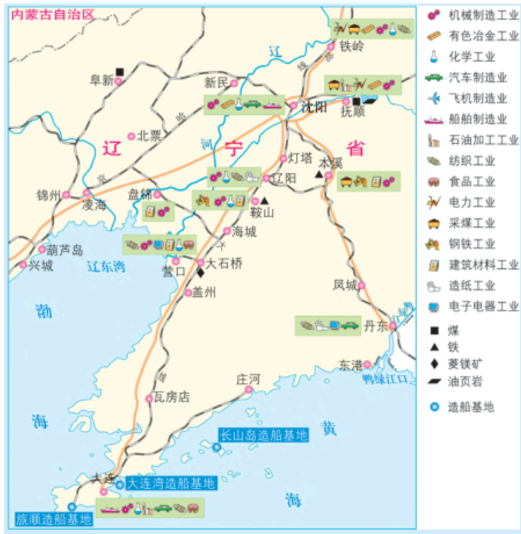
图3-2-3 辽中南工业基地示意