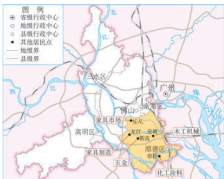
图 3.22 广东顺德家具生产专业镇分布及产业联系示意

具有工业联系的一些工厂往往发生近距离集聚现象。20世纪70年代末，广东顺德开始兴起制作家具的小型作坊。改革开放以后，家具产业在顺德逐渐集聚，从家具原材料、家具产品、家具木工机械、家具连接件和配件、家具涂料的生产与销售，到家具会展等，一应俱全（图3.22）。顺德形成了我国最早也是规模最大的家具出口基地。截至2016年年底，顺德家具约占国内市场份额的20%。