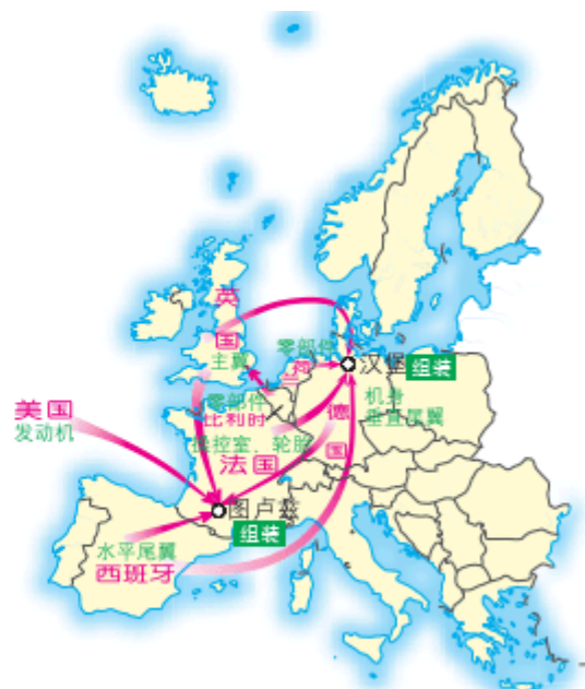
图 3-29 该公司欧洲生产网络示意

2008年，该公司在我国天津建立大型客机总装线。以此为龙头，天津相继引进了60多个航空制造项目，涵盖飞机总装、研发、维修、部附件组装、零部件制造、租赁、物流、销售、培训和服务等产业链，形成了大规模的航空产业集群。