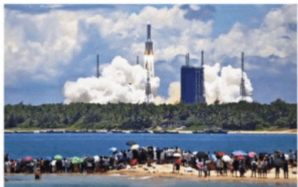
“天问一号”在海南文昌航天发射场发射升空

课题：检查进度：与小组同学一起，整理好所选区域工业布局受区位因素影响的资料，并进行分析。