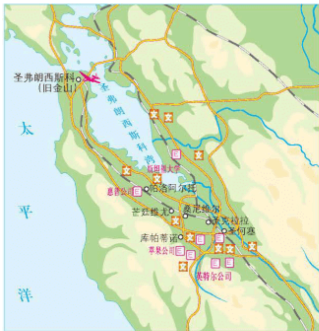
美国“硅谷” 1 : 1 200 000