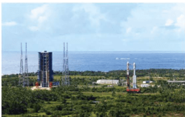
海南文昌航天发射场

4.根据材料，分析海南文昌航天发射场的区位优势。海南文昌航天发射场位于海南省文昌市龙楼镇，是世界上为数不多的低纬度发射场之一。文昌航天发射场在临海洋，地理位置优越，气候条件适宜，主要承担地球同步轨道卫星、大质量极轨卫星、大吨位空间站和深空探视卫星等航天器的发射任务。