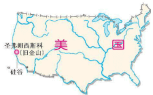
“硅谷”在美国本土的位置 1 : 85 000 000

4.根据材料，分析海南文昌航天发射场的区位优势。海南文昌航天发射场位于海南省文昌市龙楼镇，是世界上为数不多的低纬度发射场之一。文昌航天发射场在临海洋，地理位置优越，气候条件适宜，主要承担地球同步轨道卫星、大质量极轨卫星、大吨位空间站和深空探视卫星等航天器的发射任务。