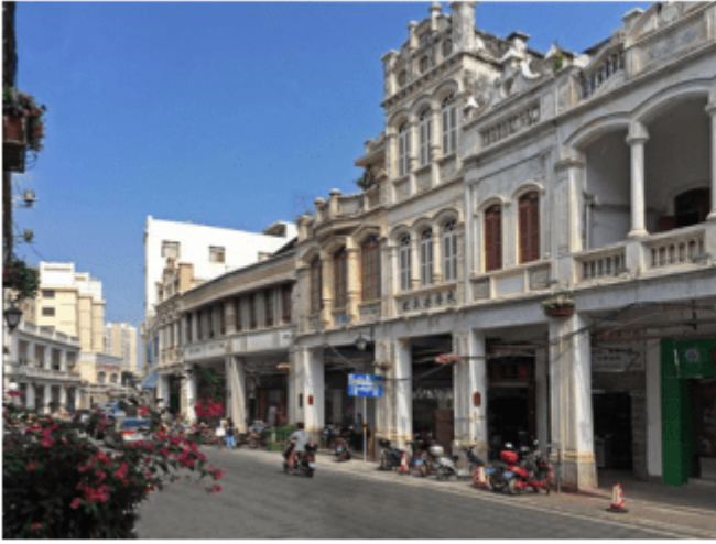
图2-2-5 海南省海口市的骑楼

地域文化在国外城市的建筑格局及建筑物风貌上的体现也十分明显。例如，意大利的威尼斯，城市中住宅往往临架在水面之上，商业建筑也多直面运河，所用的建筑材料以耐水的石材为主，形成了特色鲜明的“水城”景观。