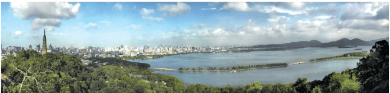
图2-2-4 “山水风光城市”浙江省杭州市

从城市建筑的格局和景观来看，地域文化特色鲜明。例如，在“天人合一”“师法自然”的中华文化影响下，形成了浙江省杭州市、山东省济南市等一批依山傍水、融自然风光和人文景观为一体的“山水风光城市”。