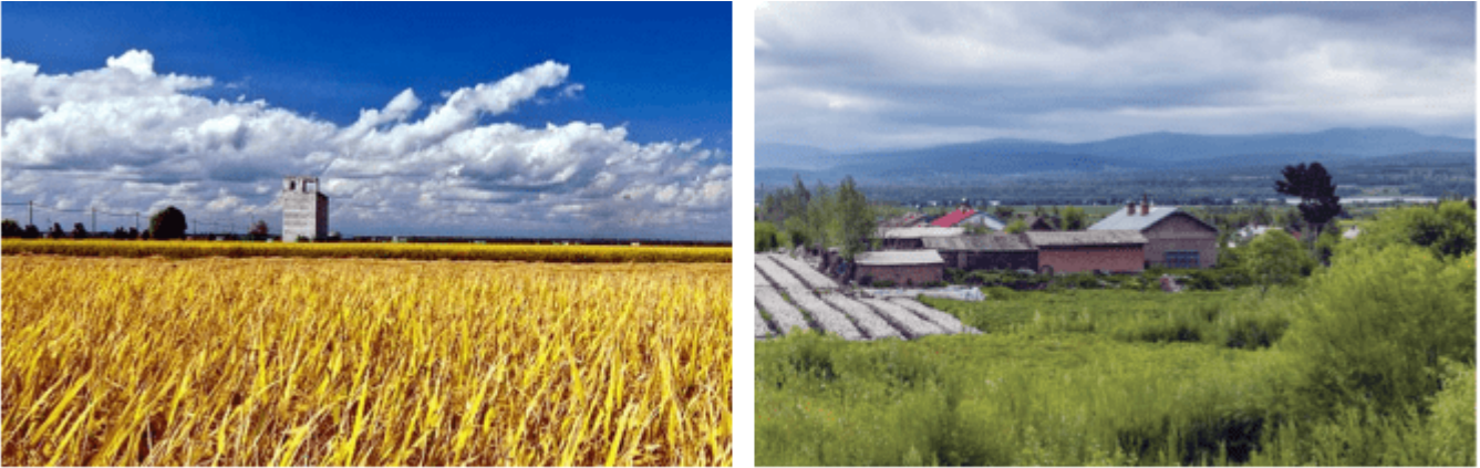
图2-2-2 黑龙江省萝北县的农田与农村村落（屯子）

城乡景观是城镇和乡村自然景观和人文景观的综合体。其空间尺度可大可小，大尺度如一个聚落，中尺度如某城市中轴线，小尺度如乡村的一座古建筑。地域文化往往体现在城乡生产景观、聚落景观以及建筑格局和主体建筑物风貌等方面。