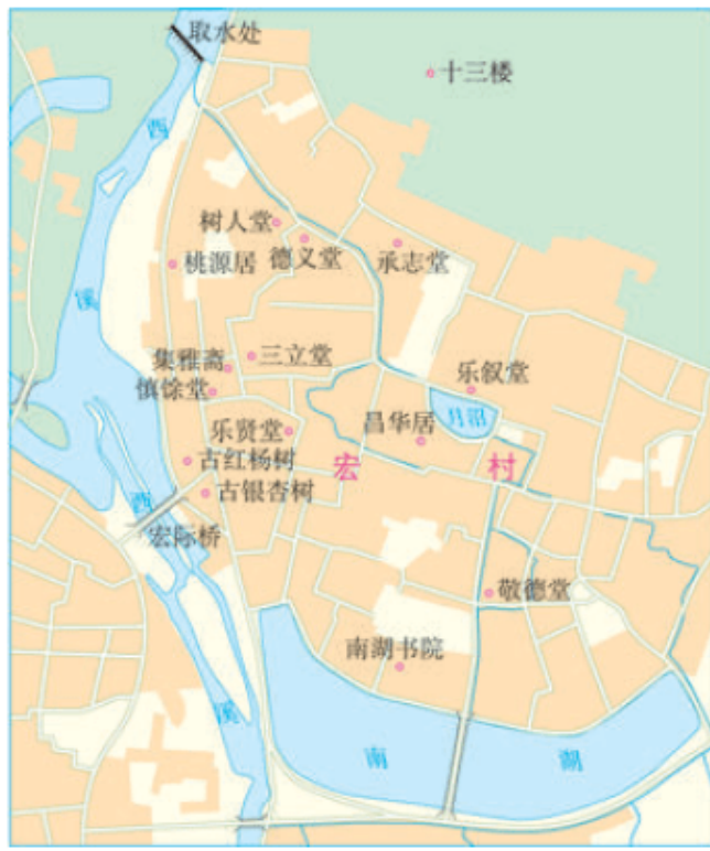
图 2.36 安徽宏村布局示意