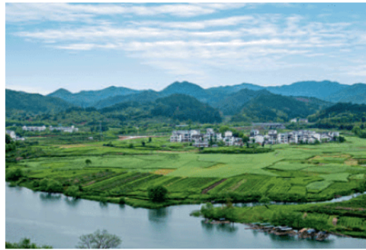
图 2.34 “宅高田低”——江西婺源月亮湾

图2.33展示了红河哈尼梯田的乡村景观，而地域文化就蕴含在其中。较之城镇，乡村的主要经济活动与自然的关系更为直接，其景观所体现的人地和谐理念更为鲜明。例如，在我国人多地少的丘陵地区，乡村民居多分布在山麓的台地或高地上，而农田则分布在相对较低的平坦区域。这种“宅高田低”的空间格局（图2.34），使得高宅可避洪水、低田便于灌溉，形成了一种人地和谐的乡村景观。乡村景观除了能够体现人们顺应自然、趋利避害的生活智慧，还能够体现当地人们的社会组织形态、精神追求等。例如，我国南方传统土楼是一种大型民居建筑，以圆楼和方楼最常见，适宜聚族而居的生活和共御外敌的要求，体现了御外凝内的集体精神（图2.35）。