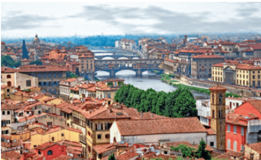
图 2.38 意大利佛罗伦萨景观