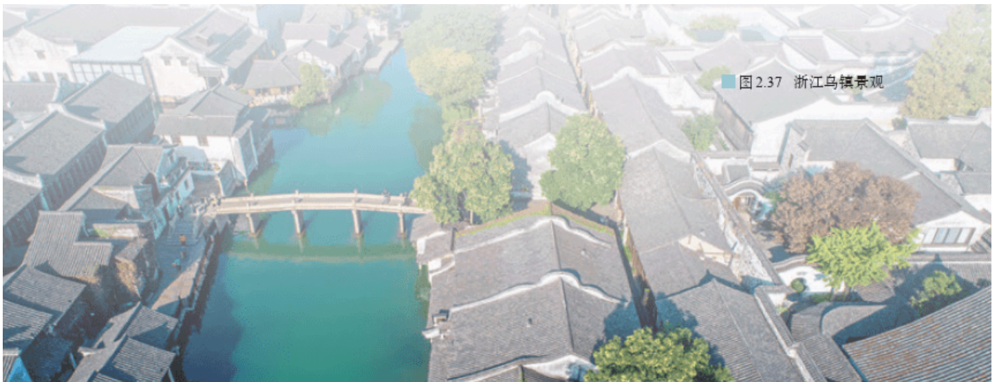
图 2.37 浙江乌镇景观

地域文化同样体现在城镇景观中。相比很多现代城镇都是钢筋混凝土、玻璃之类的灰色调，有一些城镇因其深厚的文化底蕴，会有自己的色调、色彩，例如，我国江南城镇的粉墙黛瓦（图2.37），意大利佛罗伦萨的黄橙交织（图2.38）。智利瓦尔帕莱索老城区住房的颜色五彩缤纷，就与该港口城市同欧洲的贸易往来有很大关系。港口贸易的主要运输工具是船，修船工将修船剩下的油漆调为各种颜色涂在自家的房子上，可以防止海风对木制房屋的侵蚀。这种习俗就一直延续到城市的建筑风貌上。