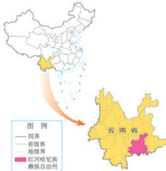
图 2.32 红河哈尼梯田位置示意

红河哈尼族彝族自治州位于云南省东南部，地处横断山区（图2.32）。2013年红河哈尼梯田被评为世界文化遗产。每年秋收以后到次年春播以前的休耕时节，是这里的旅游旺季。层层水田映照着蓝天白云，宛如一幅幅油画，吸引了无数游客。