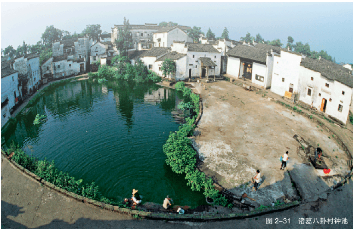
图 2-31 诸葛八卦村钟池