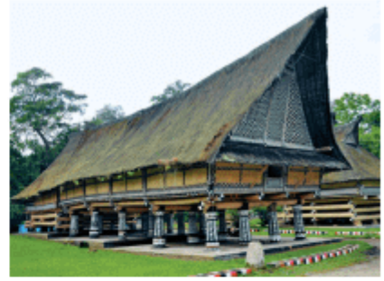
印度尼西亚巴塔克式房屋