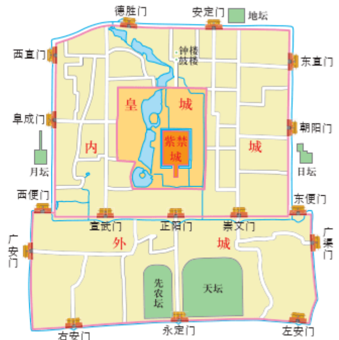
图 2-26 明清时期北京城空间格局示意