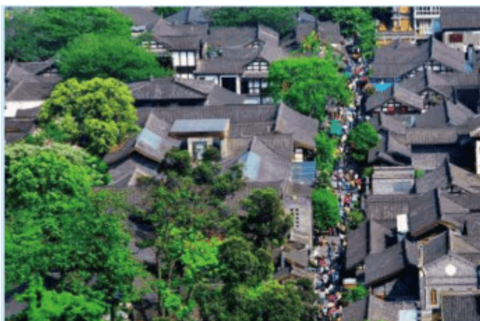
图 2-2-11 外观呈现灰色调的成都宽窄巷子