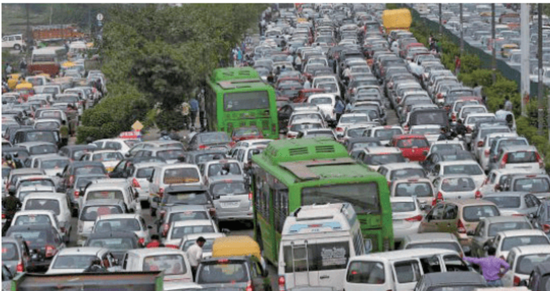
图2-3-5 城市的交通拥堵