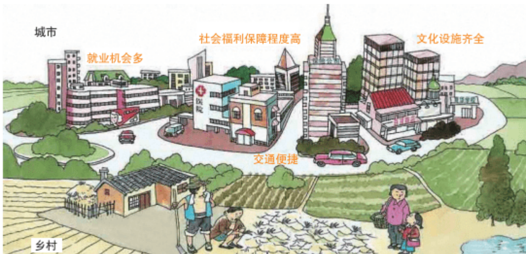
图2-3-4 城镇化是人类文明进步的产物

城镇化有利于乡村剩余劳动力向第二、三产业转移；有利于改善地区产业结构，带动区域经济发展；有利于推动科技进步，提高区域整体发展水平。此外，城镇化还有利于居民文化和思想观念的提高，促进城乡交流，缩小城乡发展差距。