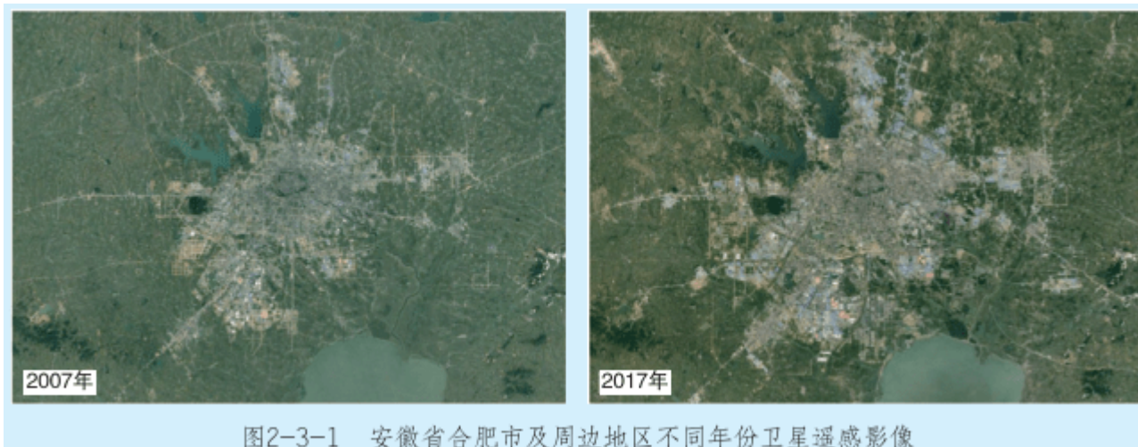
图2-3-1 安徽省合肥市及周边地区不同年份卫星遥感影像

问题:读图2-3-1, 说出2007年与2017年合肥市城镇用地规模的变化。举例说明城镇发展过程中可能产生的问题。