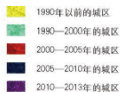
图 2-3-4 成都城区扩展示意