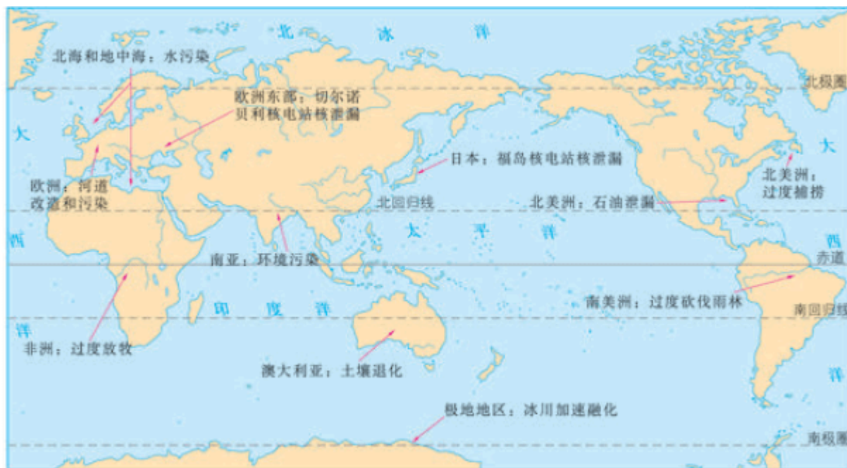
图 5.6 当今世界环境问题举例

也有从局部向全球蔓延的趋势。日益严重的环境问题，已引起世界各国普遍的忧虑和关切。如何协调人与自然的关系，探索一条可持续的发展道路，已成为当前关乎人类自身命运和前途的一个重大课题。《人类环境宣言》就是在这样的背景下诞生的。