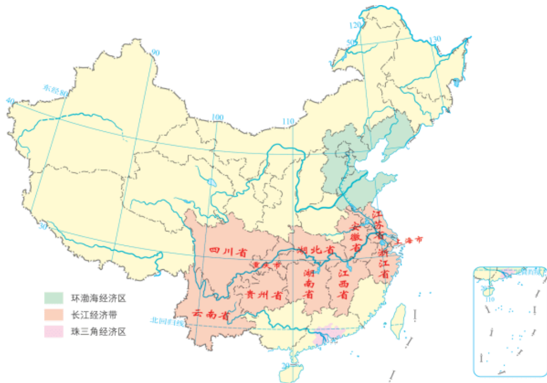
图4-2-2 长江经济带位置和范围示意

长江是我国第一大河、世界第三大河。长江经济带覆盖上海、江苏、浙江、安徽、江西、湖北、湖南、重庆、四川、云南、贵州等11个省市，面积约205万平方千米，约占全国总面积的21%，人口和生产总值均超过全国的40%，既是我国综合实力最强、战略支撑作用最大的区域之一，也是一条面向国内外开放合作的重要走廊。