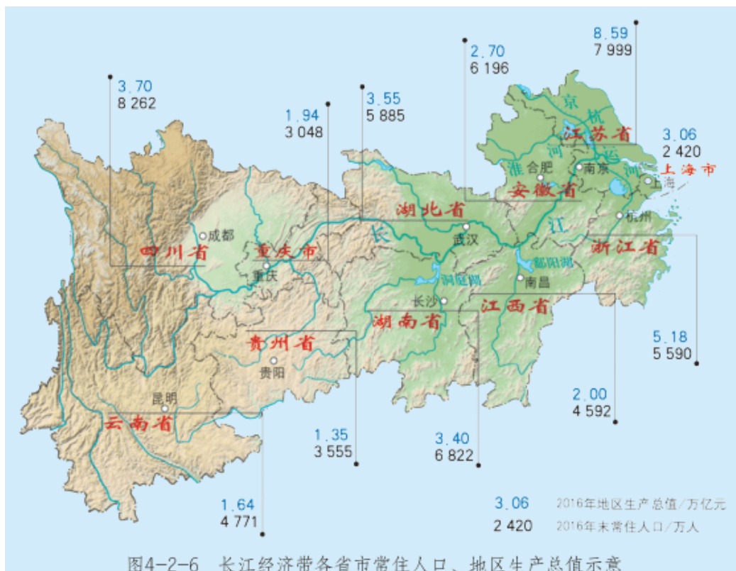
图4-2-6 长江经济带各省市常住人口、地区生产总值示意