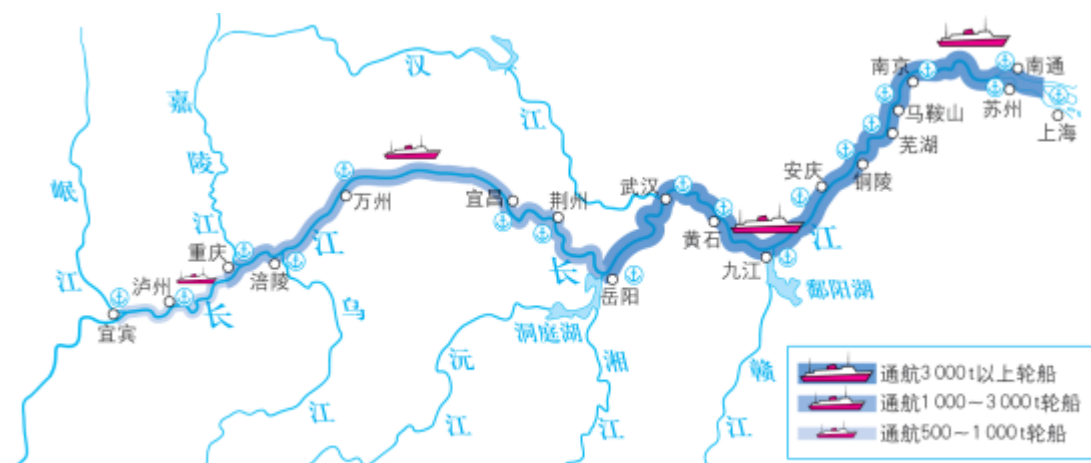
图4-2-7 长江干流各河段通航能力及主要港口分布示意

水运具有运能大、成本低、能耗小等优势。长江干线货运通过量居世界内河首位，2017年达25亿吨。长江沿岸河港众多，宜宾以下可通航，万吨巨轮可上达武汉。重庆、武汉分别是长江上游和中游航运中心，南京港是长江下游水陆联运和江海中转的枢纽港，上海是国际航运中心之一，“通江达海”的上海港已多年保持世界第一大货运港地位。