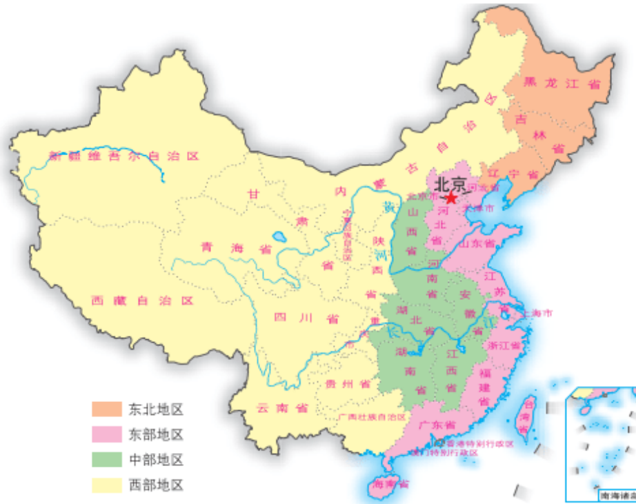
图 4-14 我国四大地区分布

我国幅员辽阔、人口众多，在自然条件、历史基础、社会经济发展水平等方面存在着较大的差别，由此形成了显著的区域发展差异。进入21世纪后，国家根据全国各地的自然条件、经济基础、发展水平和对外开放程度，把全国划分为东部、中部、西部和东北四大地区，旨在促进区域协调发展。