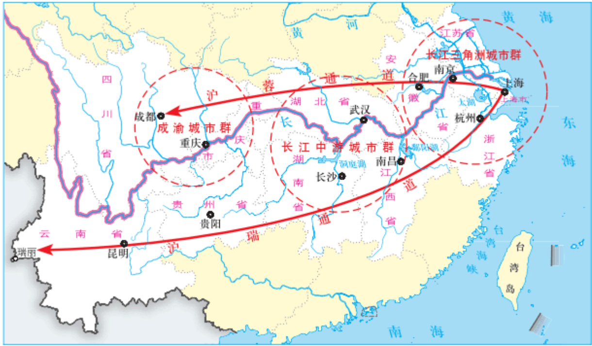
图 4-19 长江经济带空间格局示意

长江经济带是我国生态文明建设的先行示范带。统筹江河湖泊丰富多样的生态要素，推进长江经济带生态文明建设，构建以长江干支流为经脉、以山水林田湖为有机整体，江湖关系和谐、流域水质优良、生态流量充足、水土保持有效、生物种类多样的生态安全格局，使长江经济带成为水清地绿天蓝的生态廊道。