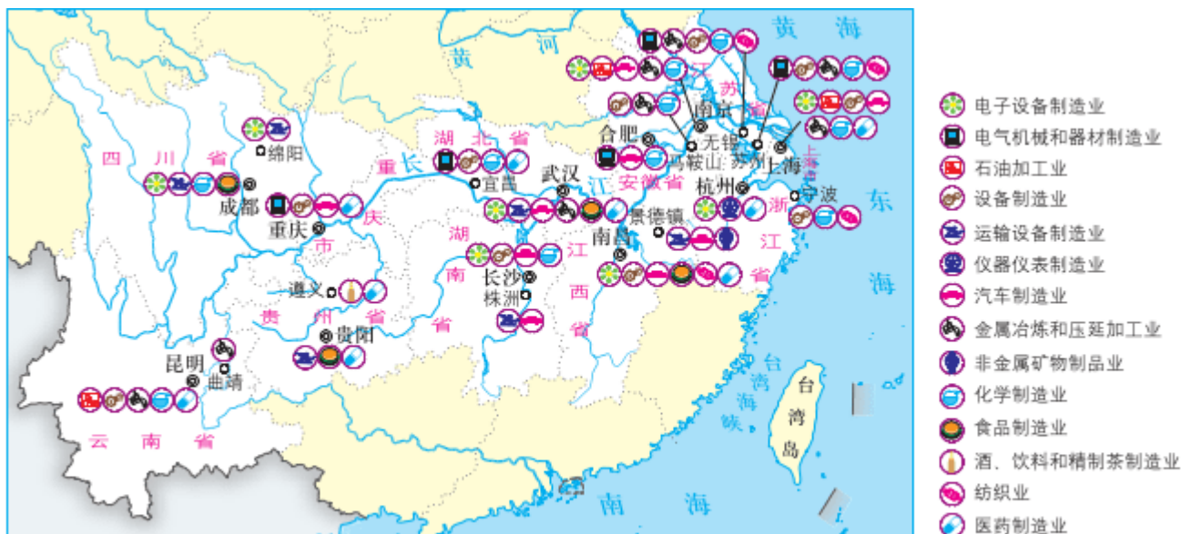
图 4-18 长江经济带产业分布

长江经济带是我国东、中、西互动合作的协调发展带。立足长江上中下游地区的比较优势，统筹人口分布、经济布局与资源环境承载能力，发挥长江三角洲地区的辐射引领作用，促进中上游地区有序承接产业转移，提高要素配置效率，激发内生发展活力，使长江经济带成为推动我国区域协调发展的示范带。