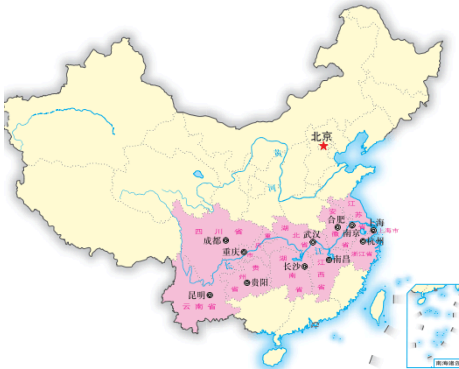
图 4-15 长江经济带范围示意

2013年，国家提出长江经济带发展战略，将长江经济带作为我国经济社会发展和转型的重要支撑。长江经济带包括上海、江苏、浙江、安徽、江西、湖北、湖南、重庆、四川、贵州、云南等省市，土地面积205万平方千米，占全国的21%，人口和经济总量均超过全国的40%。