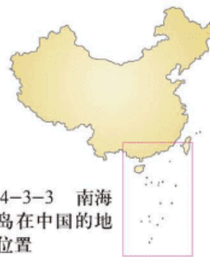
图 4-3-3 南海诸岛在中国的地理位置

南海诸岛为南海中我国许多岛礁的总称，属海南省和广东省，包括广泛分布的 200 多个岛、礁、滩、沙。按其分布位置，分为东沙群岛、西沙群岛、中沙群岛和南沙群岛。