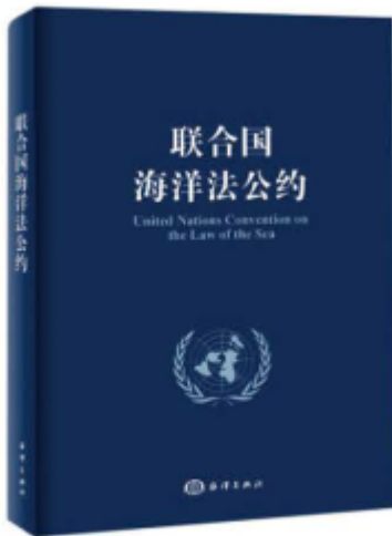
图 4-2-2 《联合国海洋法公约》

海洋权益是一个国家在海洋事务和海洋活动中依法享有的权力和利益的总称，包括领海主权、岛屿主权、司法管辖权和海洋资源开采权、海洋空间利用权、海洋污染管辖权、海洋科学研究权以及国家安全权益和海上交通权益等。