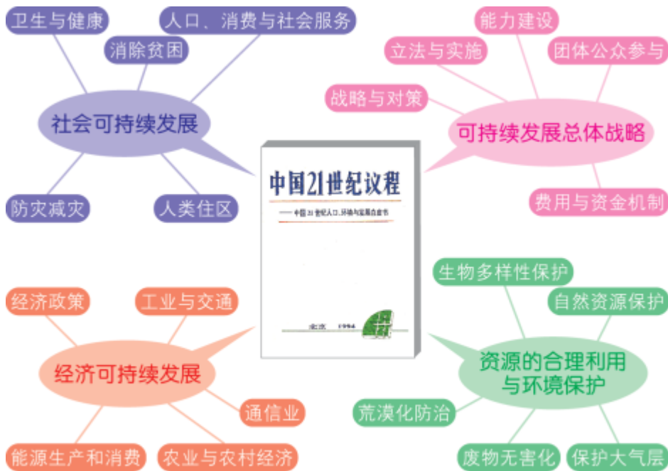
图4-4-10 中国可持续发展战略框架

国际合作和公众参与是实施可持续发展的重要条件。20世纪70年代以来，联合国多次召开环境与发展大会。中国作为国际社会的一员，在全球可持续发展和环境保护中责任重大。中国政府针对本国国情提出“控制人口，节约能源，保护环境，实现可持续发展”的行动纲领，制定了一系列可持续发展战略。