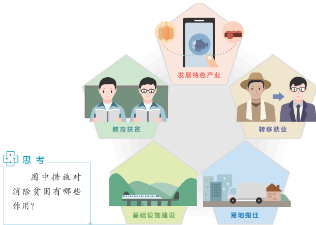
图 5.12 我国农村脱贫途径举例

•发展绿色经济：人们将基于煤炭、石油等化石能源的经济称为“褐色经济”，提出与之相对的“绿色经济”。