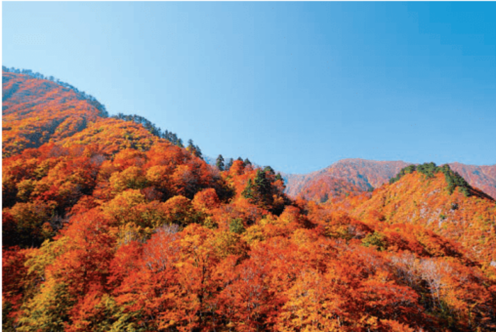
图 3-20 温带落叶阔叶林景观（秋季）

当春季气温开始回暖，乔木随即萌叶抽枝。夏季是群落旺盛的生长季节，树木叶色鲜绿，枝叶茂密，树冠郁闭。秋季气温下降，叶色转黄，树叶凋落。冬季完全无叶，而且乔木的树干和树枝都有厚的皮层保护，以御冬寒。因此，群落外貌上的季相更替，是温带落叶阔叶林的显著特征。