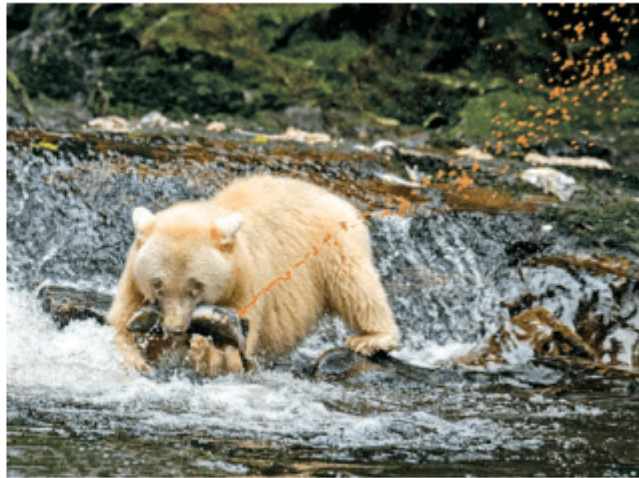
图 3-22 正在捕食的柯莫德熊