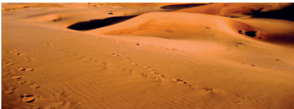
图 3-30 温带荒漠