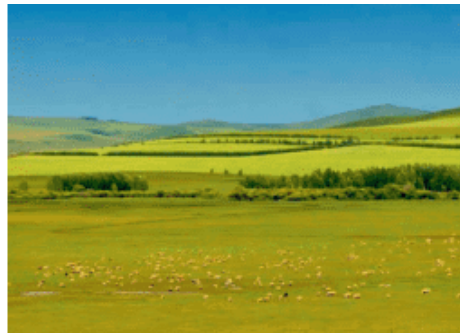
图 3-29 温带草原