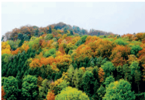
图 3-28 温带落叶阔叶林

1.比较图3-28、图3-29和图3-30中植被景观的差异，讨论气候对其植被景观形成的重要意义。