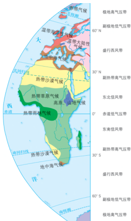
图3-2-4 气压带、风带对气候的影响示意

南北纬 10^{\circ} \sim 25^{\circ} 地区，当受赤道低气压影响时，气流上升，降水丰沛；当受信风影响时，干燥少雨。形成全年高温、干湿分明的热带草原气候与稀树草原景观。