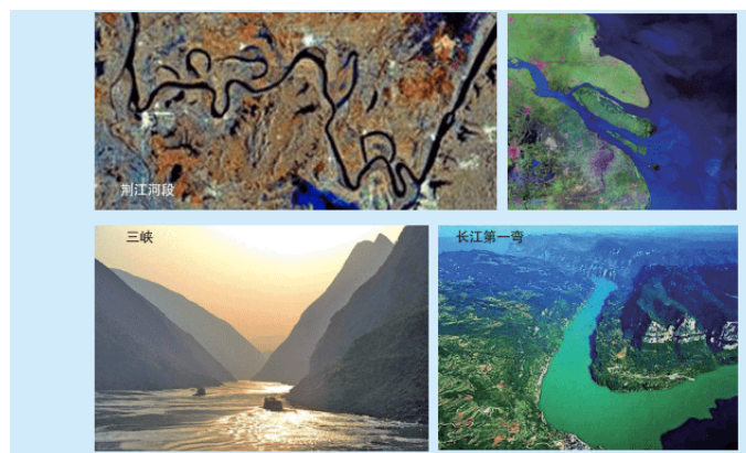
图3-3-9 长江干流地貌组照