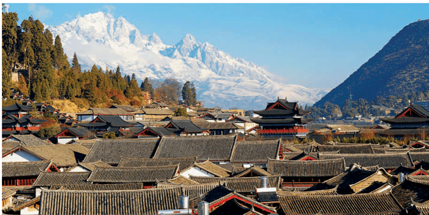
图 2-55 丽江古城景观