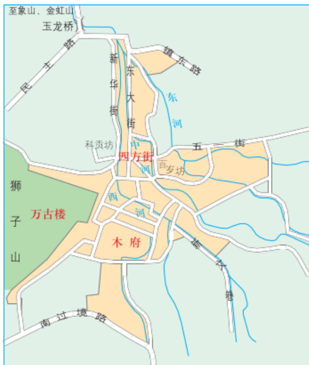
图 2-54 丽江古城平面图