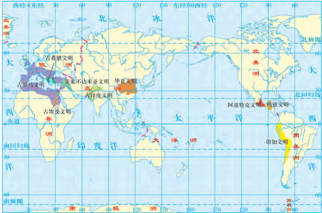
世界古代文明分布