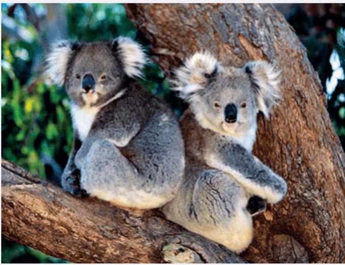
图 5-1 树袋熊

树袋熊又称考拉，分布在澳大利亚大分水岭东北部、东部沿海岛屿和内陆低地的桉树林中，主要以桉树叶为食。树袋熊集中分布区也是人类喜欢的定居之地。因受人类活动的干扰，树袋熊面临很大的生态威胁。当地居民认为，人类集中居住干扰了树袋熊的生活，于是把房屋分散修建于桉树林中。可事与愿违，分散居住的结果，反而对树袋熊栖息地造成更大的威胁。