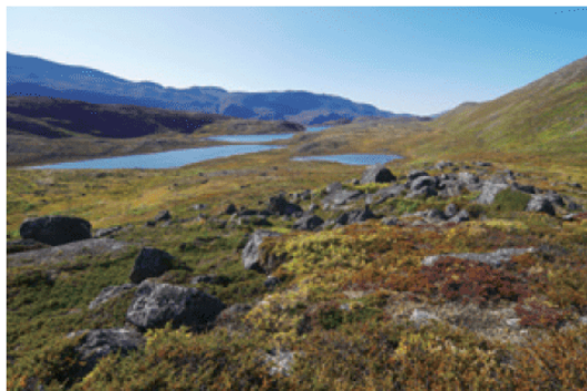
■ 图 5.8 苔原景观