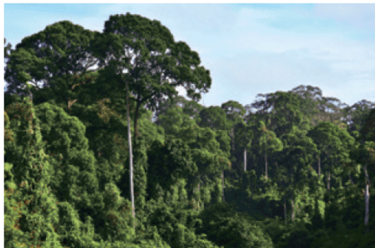
■ 图 5.9 热带雨林景观