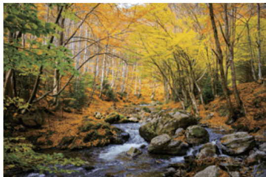
■ 图 5.10 温带落叶阔叶林景观