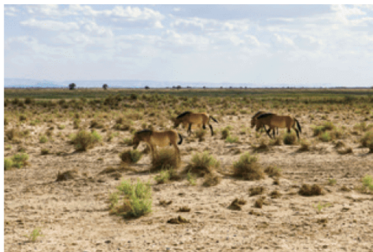
■ 图 5.11 温带荒漠景观

在中纬度地区，从沿海向大陆内部也产生了地域分异，呈现森林带—草原带—荒漠带（图5.11）的变化规律。