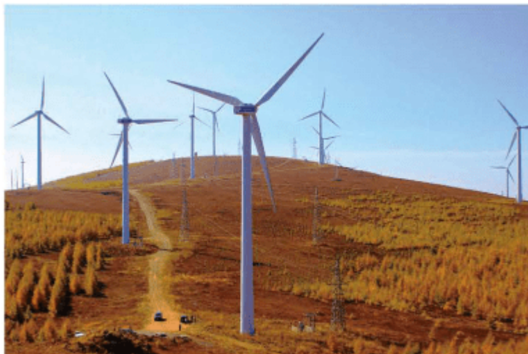
河北坝上风力发电场