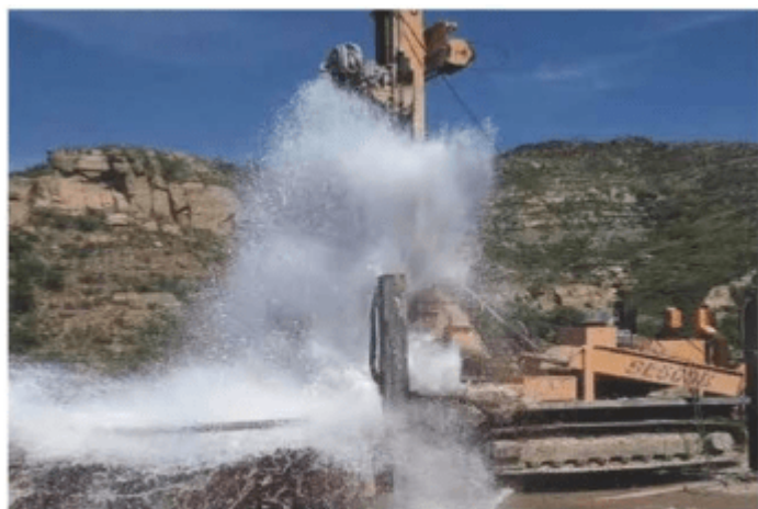
高邮市神居山地热井