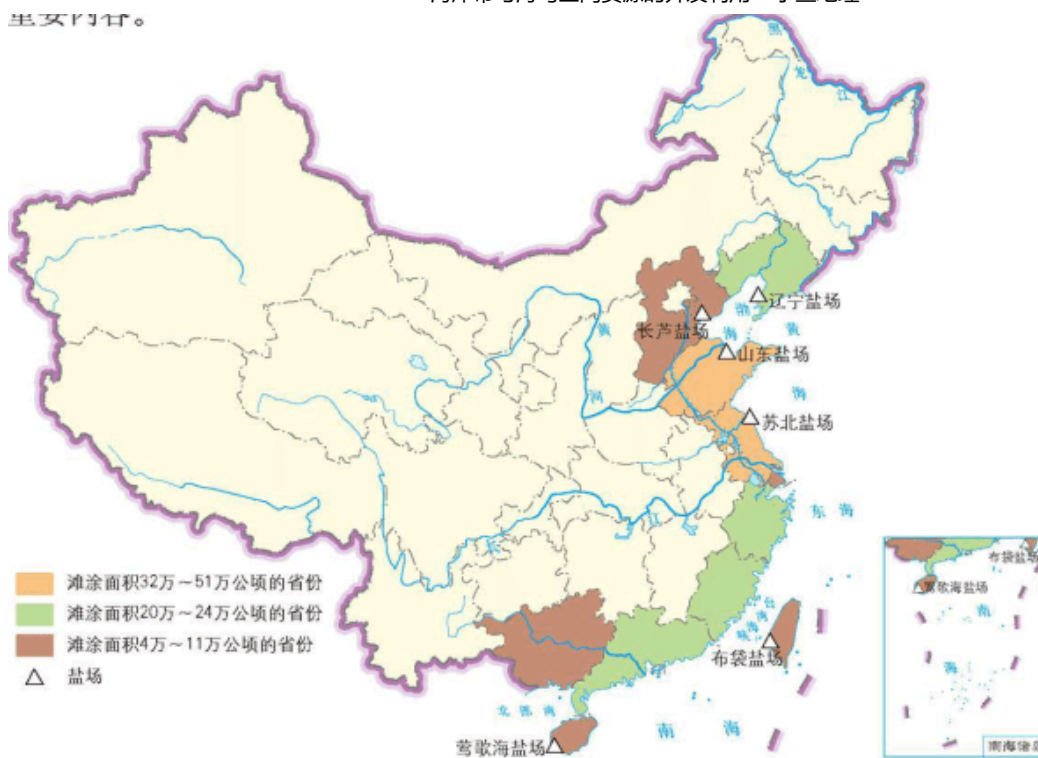
图2-3-5 中国沿海滩涂分布 1:40 000 000

海洋自然保护区是针对海岸带范围内的特有动植物品种或资源、以及它们的生存环境等实行保护和进行特殊管理的区域。它不仅有明确的保护对象，而且还通过立法进行管理。