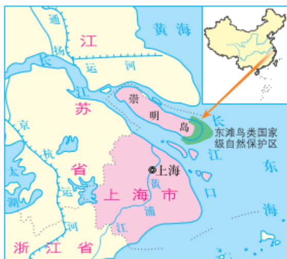
图 3-13 崇明东滩地理位置