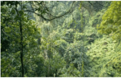
图2-2-2 广东鼎湖山自然保护区

自然保护区的内部结构一般由三部分组成： 核心区 ——保存完好的天然状态的生态系统以及珍稀濒危动植物的集中分布地，区内严禁一切干扰活动； 缓冲区 ——环绕核心区的周围地带，只准进入从事科学研究观测活动； 外围区 ——即实验区，位于缓冲区的周围，可以进入从事科学试验、教学实习、参观考察、旅游以及驯化、繁殖珍稀濒危野生动植物等活动。