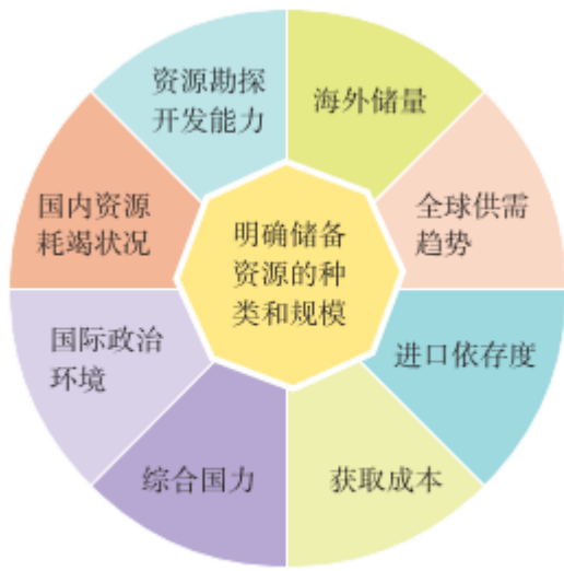
图 4.7 制定战略资源储备政策需要考虑的因素