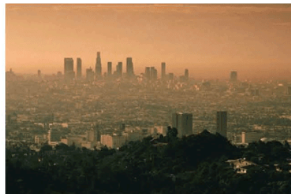
1943年5月至10月，洛杉矶大量汽车尾气产生的光化学烟雾，在6个月时间内造成400多位65岁以上老人死亡。

第一阶段:工业革命以来，人类生产力水平显著提高，但传统工业过度消耗自然资源，大量排放污染物，生态环境大范围遭受破坏，人类为此付出了沉痛代价。20世纪30年代至60年代，相继发生了比利时马斯河谷烟雾事件、美国洛杉矶光化学烟雾事件、英国伦敦烟雾事件、日本水俣病事件等八大公害事件。