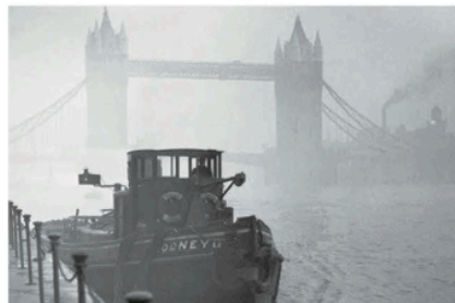
1952年12月，伦敦由于燃煤产生大量煤烟，发生严重烟雾事件，整座城市弥漫着浓烈的臭鸡蛋味，导致4 000多人死亡，此后两个月内又有8 000多人陆续死亡。