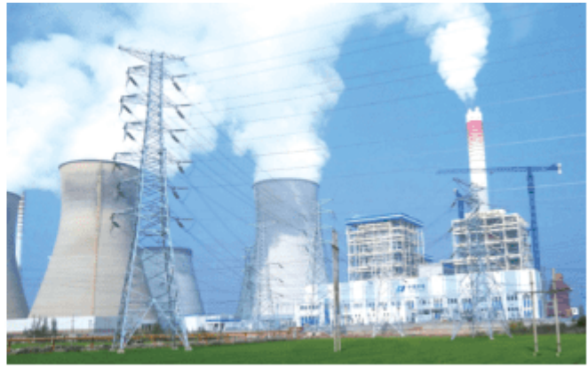
图2-4-4 安装了除尘装置的华电十里泉电厂