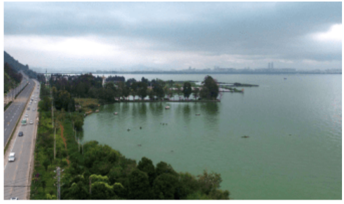
图2-4-8 经持续治理后水质明显改善的滇池