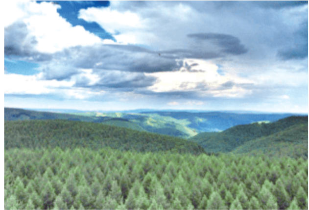
图2-4-9 “沙地变林海，荒原变绿洲”的河北塞罕坝林场

我国环境保护的实践和成就充分表明，制定符合国情的环境保护政策，采取严格有效的环境保护措施，是改善生态环境状况、维护国家生态安全的重要途径。