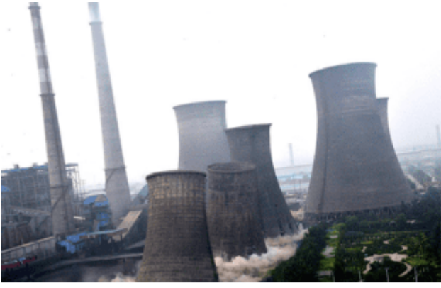
图2-4-7 淘汰落后产能“小火电”爆破现场