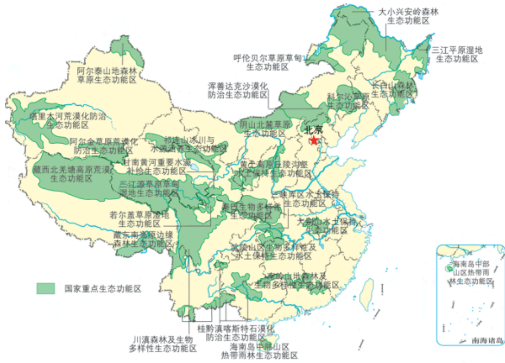
图2-4-10 国家重点生态功能区示意