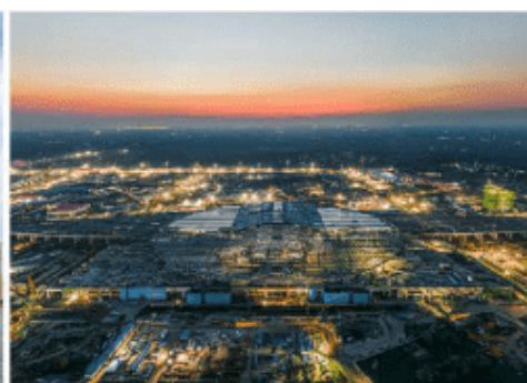
建设中的雄安新区